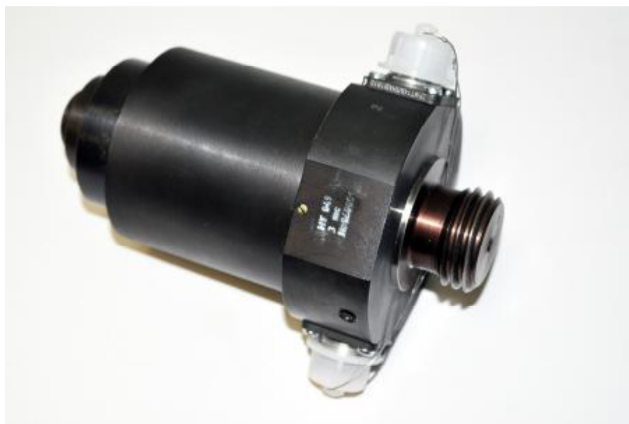
Рисунок 1 - Общий вид датчика НТ 049

Общий вид датчика НТ 049 приведен на рисунке 1, габаритные и установочные размеры – на рисунке 2.