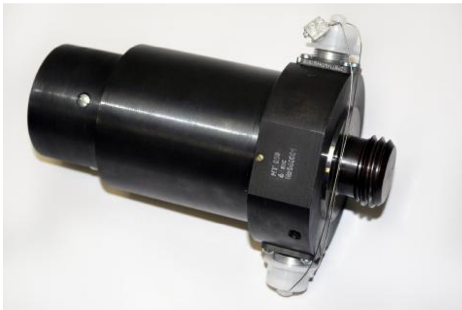
Рисунок 1 - Общий вид датчика НТ 050

Общий вид датчика НТ 050 приведен на рисунке 1, габаритные и установочные размеры – на рисунке 2.