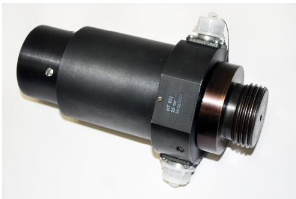
Рисунок 1 - Общий вид датчика НТ 052

Общий вид датчика НТ 052 приведен на рисунке 1, габаритные и установочные размеры – на рисунке 2.