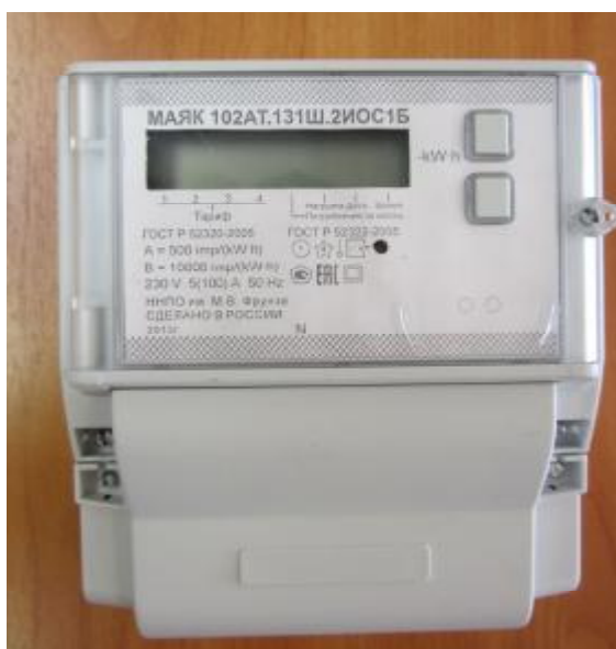
Рисунок 1 – Внешний вид счетчика с закрытой клеммной крышкой

Внешний вид счетчика МАЯК 102АТ с закрытой клеммной крышкой приведен на рисунке 1.