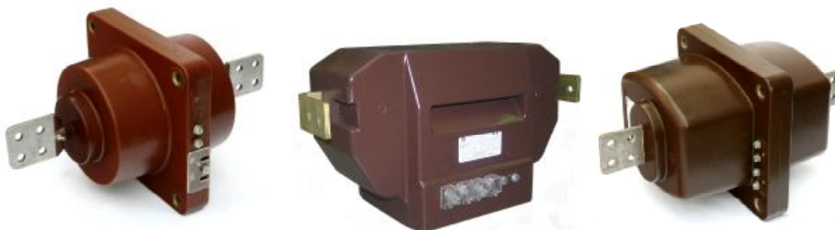
Рисунок 1 - Фотографии общего вида трансформаторов тока ТПЛ-СЭЩ-10

Принцип действия трансформаторов тока основан на явлении электромагнитной индукции переменного тока.