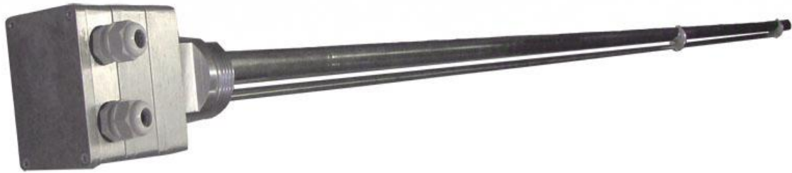
Рис.1 Внешний вид первичного преобразователя ДЖС-7М

После проведения поверки крышка электронного блока первичного преобразователя ДЖС-7М пломбируется. Способ пломбировки крышки электронного блока показан на Рис.2