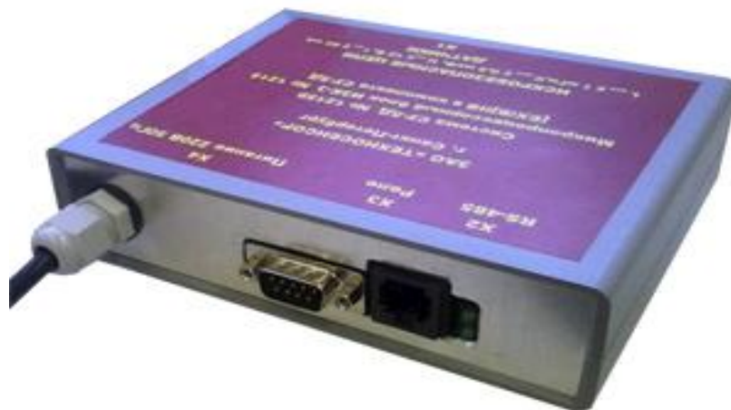
Рис.3. Электронный блок ИЗК-3.

Измеренные текущие значения электрической емкости резонатора, температуры измеряемой среды электронным блоком первичного преобразователя по линиям связи по интерфейсу RS-485 передает на блок ИЗК-3. Блок ИЗК-3 выполняет температурную компенсацию показаний первичного преобразователя в зависимости от текущей температуры и, используя записанную в энергонезависимую память градуировочную характеристику первичного преобразователя преобразует полученные значения электрической емкости резонатора в значения масс жидкой и паровой фаз нефтепродукта в резервуаре, а также используя встроенное ПО рассчитывает значения плотностей и объемов жидкой и паровой фаз нефтепродукта в резервуаре в режиме реального времени. Метрологические характеристики рассчитанных значений плотностей и объемов жидкой и паровой фазы нефтепродукта не нормированы.