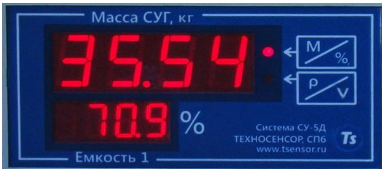
Рис.4. Светодиодный индикатор СМН-1

Блок ИЗК-3 может передавать измерительную информацию по стандартному протоколу MODBUS ASCII на ПЭВМ оператора МАЗС или нефтебазы. Применение стандартного протокола позволяет интегрировать систему в уже имеющуюся на объекте АСУ ТП (SCADA-системы или АРМ оператора), и не устанавливать дополнительное ПО на ПЭВМ.