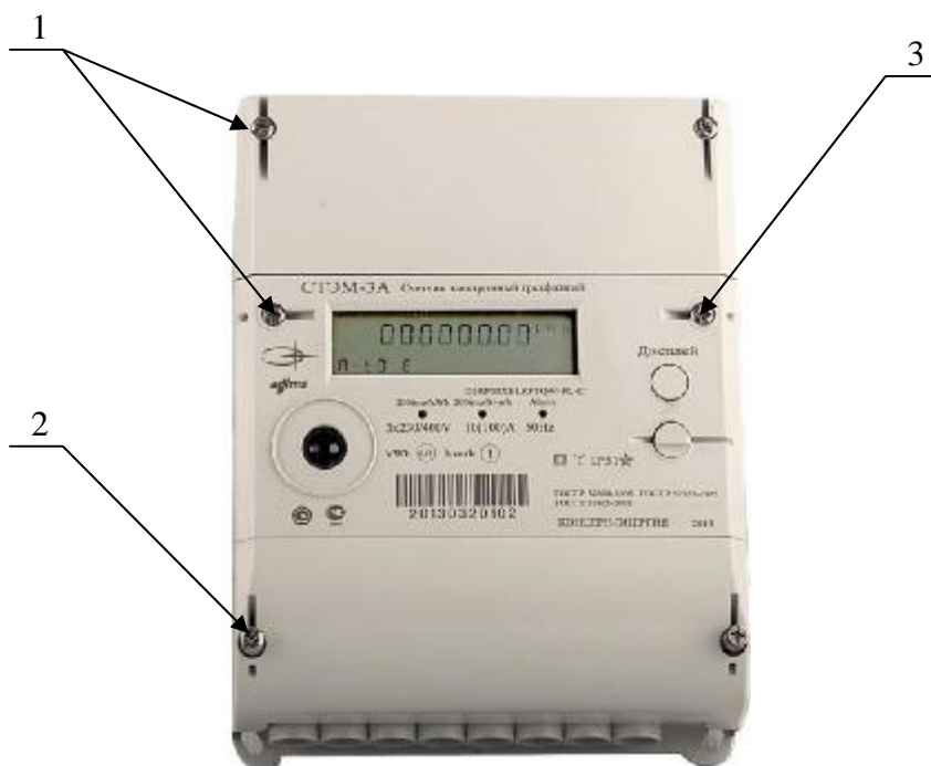
Рисунок 1 – Фотография общего вида счетчиков электрической энергии однофазных многотарифных СТЭМ-3А непосредственного включения, где 1 – пломба ОТК завода-изготовителя; 2 – пломба энергоснабжающей организации; 3 – пломба поверяющей организации.