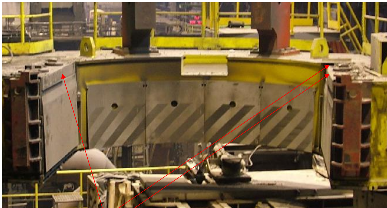
Места установки весоизмерительных тензорезисторных датчиков