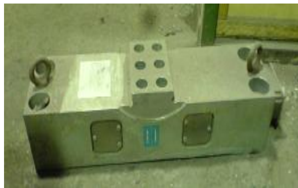
в) весоизмерительный тензорезисторный датчик