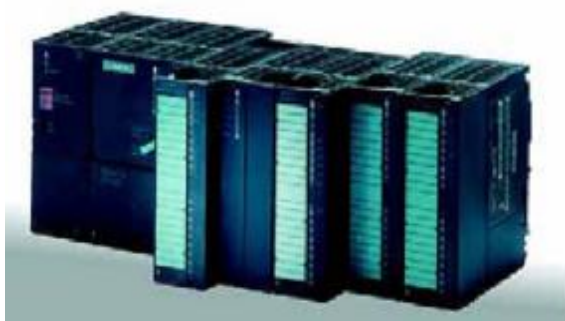
б) устройство весоизмерительное