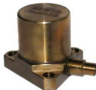
Рисунок 4 – Вибропреобразователь AP63B