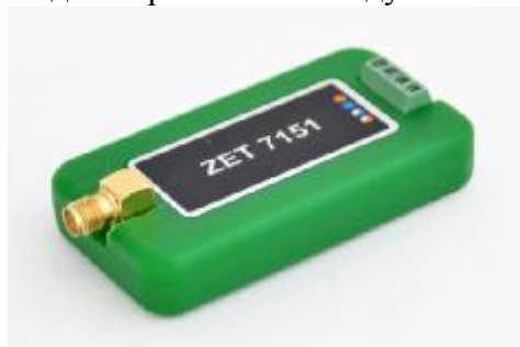
Рисунок 7 – Общий вид измерительного модуля в пластиковом корпусе