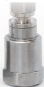
Рисунок 1 – Акселерометр BC 111

В акселерометрах BC 111 (рисунок 1) и BC 112 (рисунок 2) использован пьезочувствительный элемент в виде кольца с поляризацией по толщине. Съём заряда с пьезоэлемента акселерометра производится при помощи встроенного кабеля, который соединяет акселерометр с измерительным модулем.