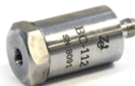
Рисунок 2 – Акселерометр BC 112