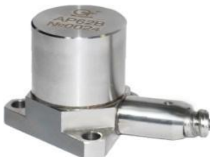
Рисунок 3 – Вибропреобразователь AP62B