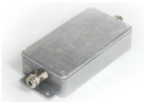
Рисунок 6 – Общий вид измерительного модуля в металлическом корпусе

Также предусмотрен вариант выполнения измерительного модуля в пластиковом корпусе (рисунок 7).