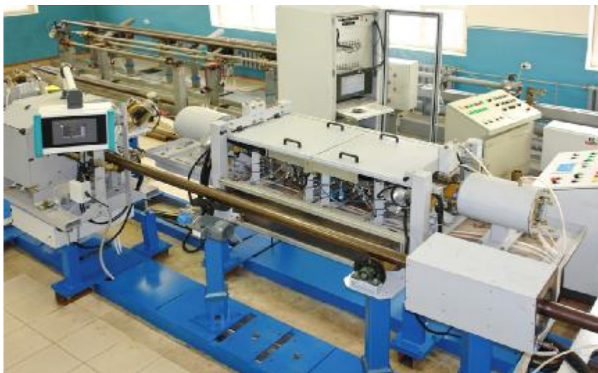
Рисунок 1 – Внешний вид комплекса неразрушающего контроля труб «УНКТ-500»