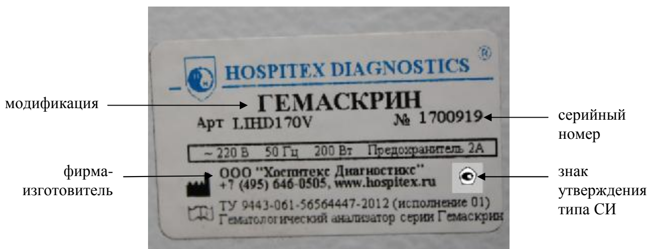
Рисунок 4 – Схема маркировки анализаторов

В анализаторах используется встроенное программное обеспечение, которое устанавливается заводом-изготовителем непосредственно в ПЗУ анализаторов.