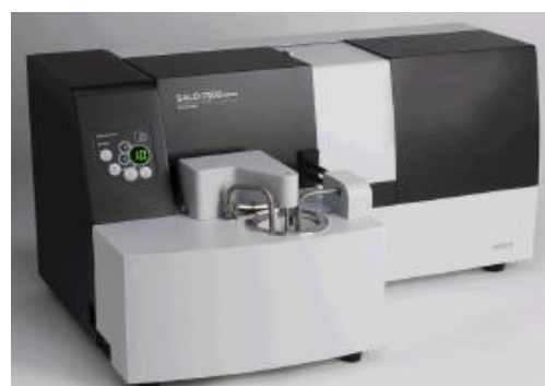
Рис. 6. Модель SALD-7500nano