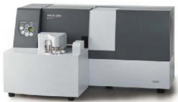
Рис. 5. Модель SALD-2300