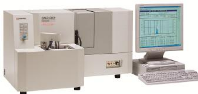
Рис. 2. Модель SALD-2201