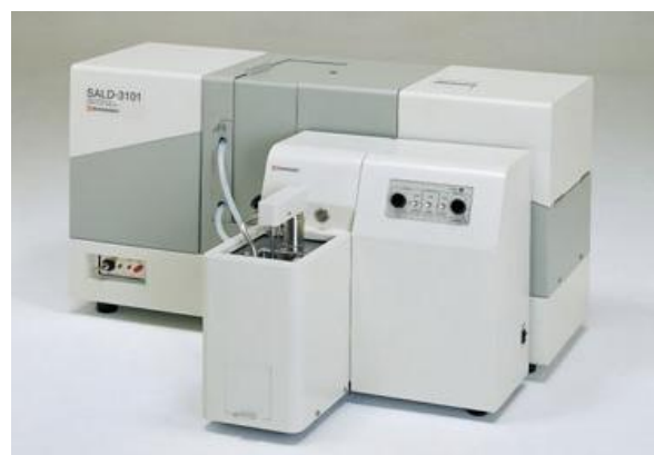
Рис. 4. Модель SALD-3101