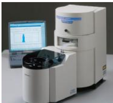
Рис. 1. Модели SALD-201V, SALD-301V

Управление анализаторами осуществляется с помощью персонального компьютера.