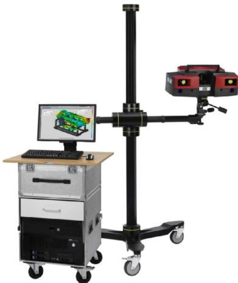
Рисунок 1 – Общий вид системы оптической координатно-измерительной топометрической ATOS Triple Scan

Системы оптические координатно-измерительные топометрические ATOS выпускаются следующих модификаций: ATOS I rev.01; ATOS II rev.01; ATOS II XL rev.01; ATOS IIe rev.01, ATOS IIe XL rev.01, ATOS III rev.01, ATOS III XL rev.01, ATOS Compact Scan 2M, ATOS Compact Scan XL 2M, ATOS Compact Scan 5M, ATOS Compact Scan XL 5M, ATOS II Triple Scan, ATOS II Triple Scan XL, ATOS III Triple Scan, ATOS III Triple Scan XL, ATOS Triple Scan 12M, ATOS Triple Scan XL 12M, ATOS II Triple Scan with ATOS Plus, ATOS III Triple Scan with ATOS Plus, ATOS Triple Scan 12M with ATOS Plus, ATOS Core отличающиеся друг от друга измерительными объемами, шагом дискретности между измеряемыми точками и разрешением матриц цифровых камер (Рисунок 1).