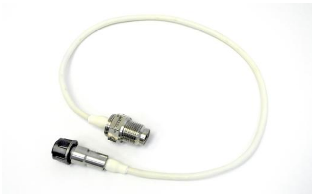
Рисунок 1 - Общий вид датчика ДДВ 015

Общий вид датчика ДДВ 015 приведен на рисунке 1, габаритные и установочные размеры – на рисунке 2.