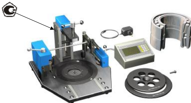
Рисунок 1 - Внешний вид приборов для контроля радиального зазора подшипников модель БВ-7602-33 и место нанесения знака утверждения типа.