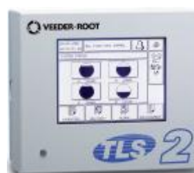
Рисунок 8 – Контроллер TLS-2X