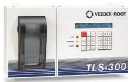
Рисунок 6 – Контроллер TLS-300X