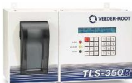
Рисунок 5 – Контроллер TLS-350X