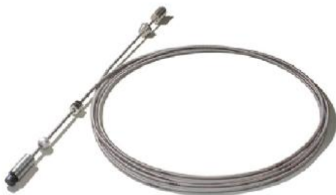
Рисунок 3 - Зонд Mag plus 1 Mag-FLEX