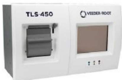
Рисунок 4 – Контроллер TLS-450X