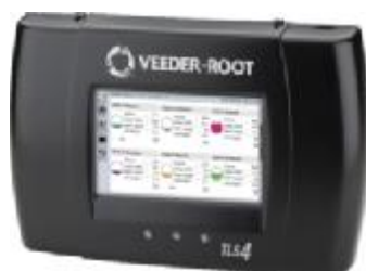
Рисунок 7 – Контроллер TLS-4X