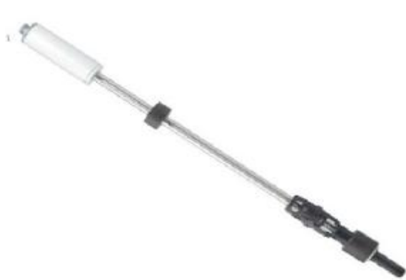
Рисунок 2 - Зонд 8463X с плотномером

В минимальную базовую комплектацию систем входят зонд и контроллер.