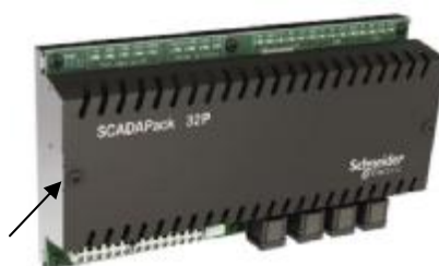
Рисунок 2 - Схема пломбирования контроллера установки

Пломбирование на предприятии-изготовителе осуществляется путем нанесения пломб или наклеек в место, указанное стрелкой (рис.2).