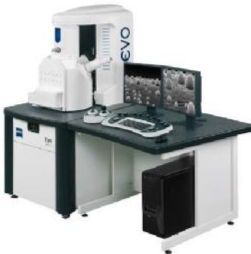
Рисунок 1 – Общий вид микроскопа сканирующего электронного EVO MA25.

Микроскоп оснащен двумя вспомогательными телекамерами инфракрасного диапазона, которые позволяют в реальном времени и с увеличением около 1,5 раз контролировать перемещения и повороты объекта гониометрическим держателем препаратов.