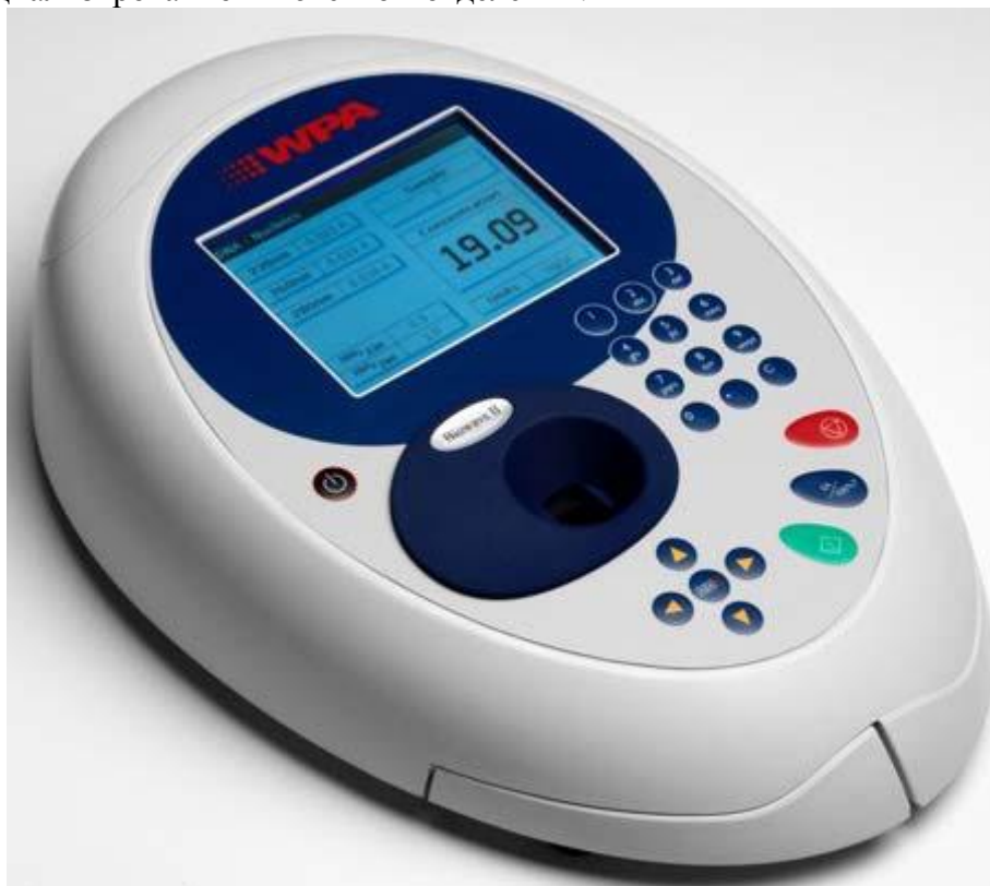
Рисунок 1 – Общий вид спектрофотометра

Спектрофотометры выпускаются в настольном стационарном исполнении со встроенным программным обеспечением. Измерения оптических плотностей жидких проб проводится в специализированном кюветном отделении.