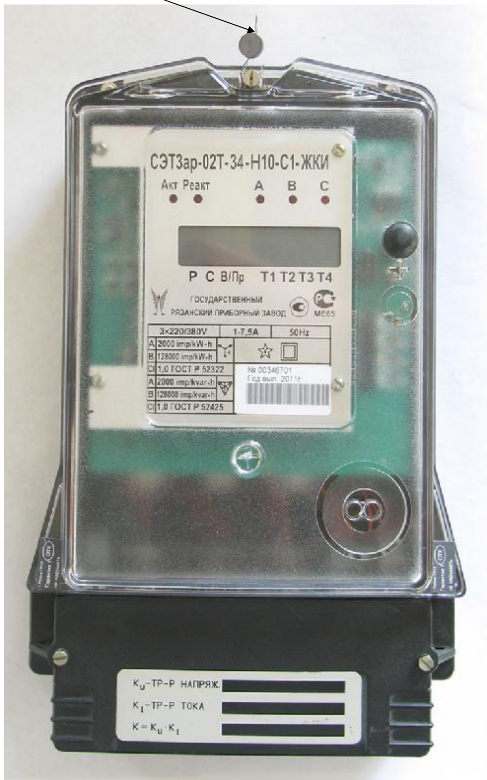
Рисунок 2– Общий вид счетчика