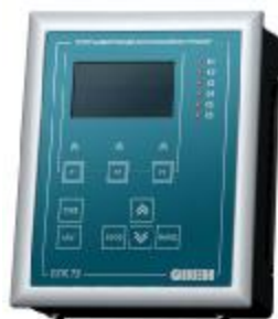
Рис. 4 Внешний вид и схема пломбирования индикатора ЭТД-01