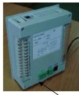
Место установки пломбы