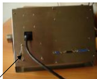
Место установки пломбы