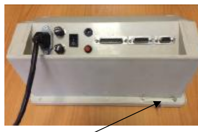
Место установки пломбы