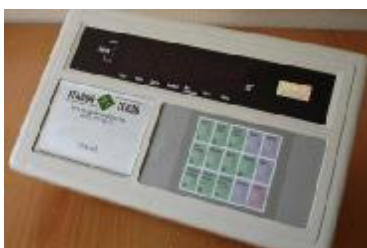
Рис.2 Внешний вид и схема пломбирования индикатора СИ-2001А