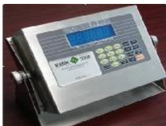
Рис.3 Внешний вид и схема пломбирования индикатора ЭТА-01