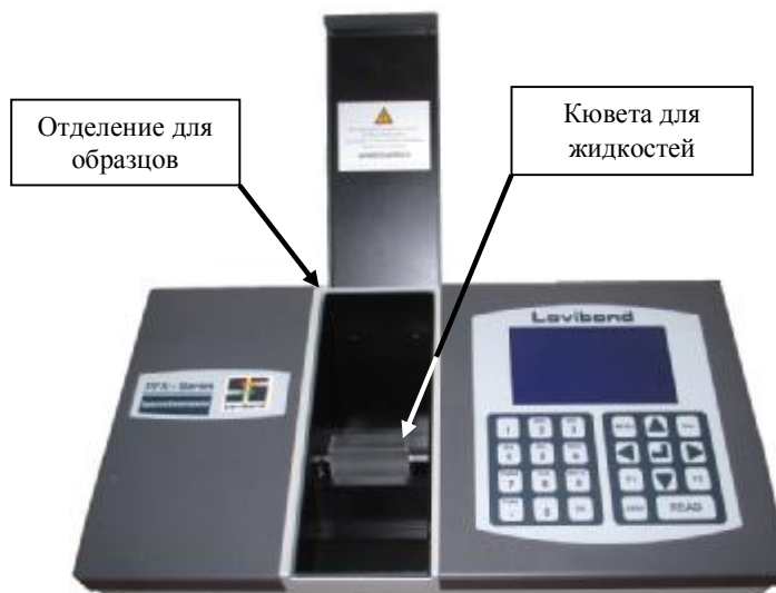
Рисунок 1 - Общий вид спектроколориметров Lovibond серии PFXi моделей 880, 950 и 995.

В модели 995/P в базовой комплектации активированы функции: Шкала ASTM, Шкала Гарднера, Единицы IP, Значение по Lovibond RYBN, Платина-кобальт/Хазен/АРНА, Шкала Сейболта, Хазена (Pt-Co) АРНА, Сейболта, Спектральные данные (коэффициент пропускания и оптическая плотность), Значения CIE (координаты цвета XYZ; координаты цветности xY; цветовое пространство L*a*b*; шкала цвета по модели CIE LCh, цветовое различие ΔE).