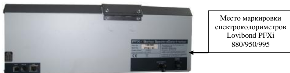
Рисунок 2 – Вид сзади и маркировка спектроколориметров Lovibond серии PFXi моделей 880, 950 и 995.