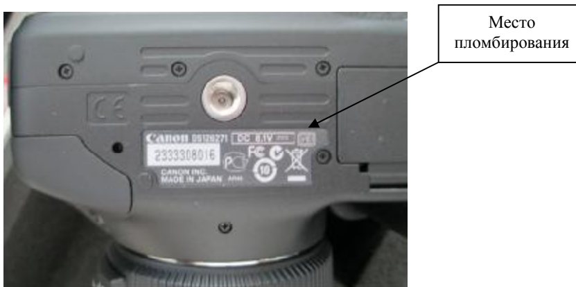
Рисунок 3 - Маркировка и пломбирование камеры LMK mobile advanced.