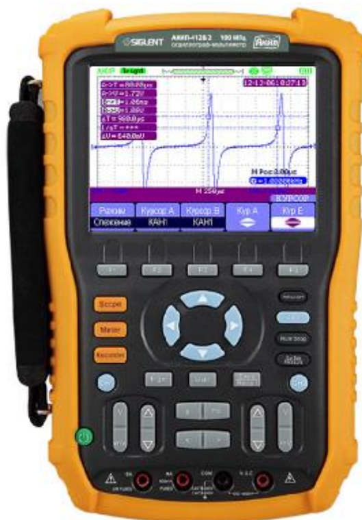
Рисунок 1. Фотография общего вида осциллографов-мультиметров

Фотография общего вида осциллографов-мультиметров представлена на рис. 1. Схема пломбировки от несанкционированного доступа изображена на рис. 2.