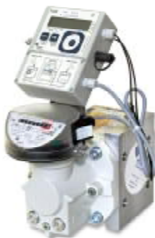
Комплекс СГ-ТК-Р на базе RVG