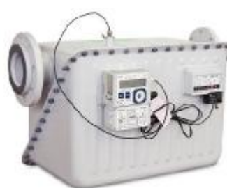
Комплекс СГ-ТК-Д на базе VK-G