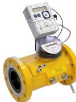
Комплекс СГ-ТК-Т на базе TRZ