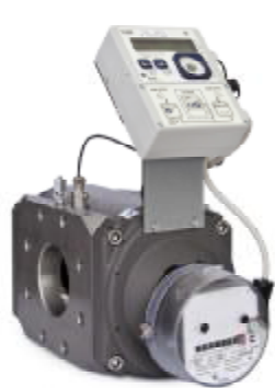
Комплекс СГ-ТК-Р на базе RABO