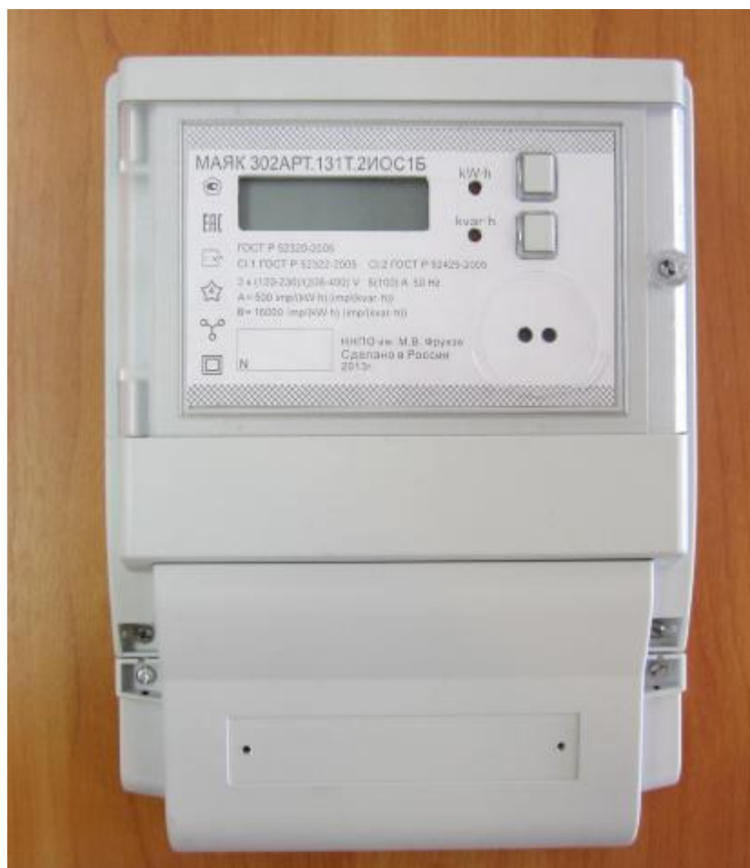
Рисунок 1 – Внешний вид счетчика с закрытой клеммной крышкой

Внешний вид счетчика МАЯК 302АРТ с закрытой клеммной крышкой приведен на рисунке 1.