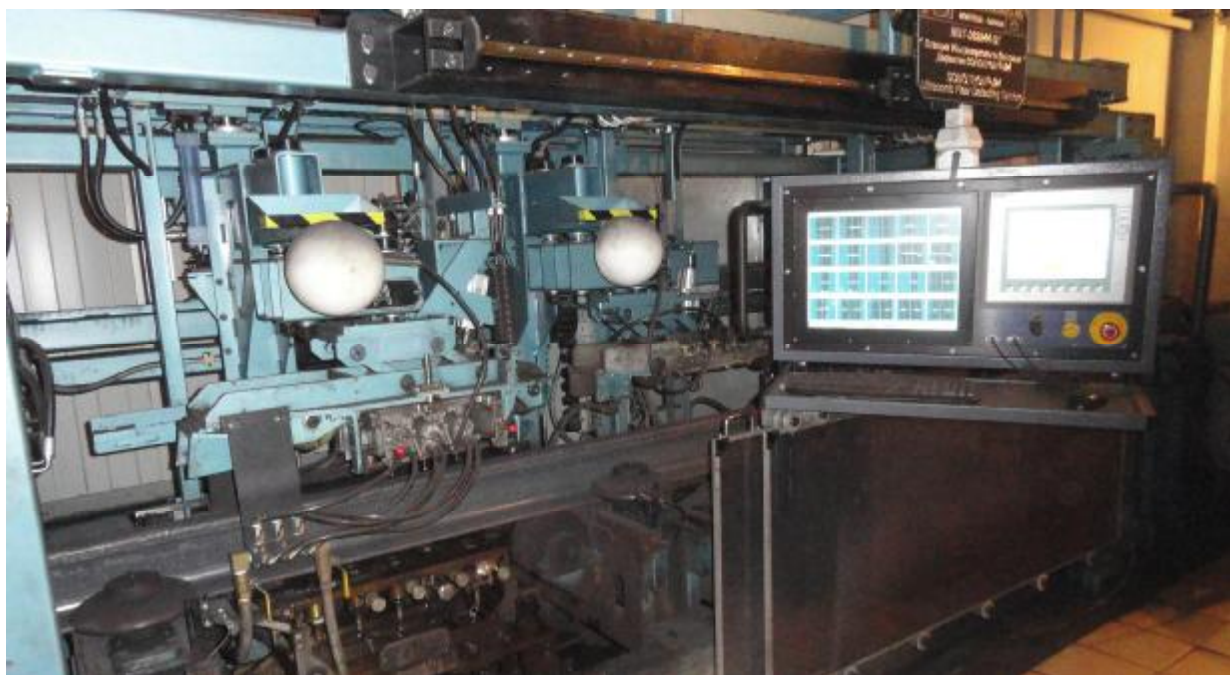
Рисунок 1 – Общий вид системы

На рисунке 1 представлена фотография общего вида системы.