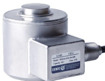
Рисунок 1 - Общий вид датчиков серии DBM14A

Датчики выпускаются в восьми сериях, общий вид которых представлен на рисунках 1 – 8. Пример маркировки датчиков представлен на рисунке 9.