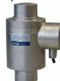
Рисунок 4 - Общий вид датчиков серии DBM14K