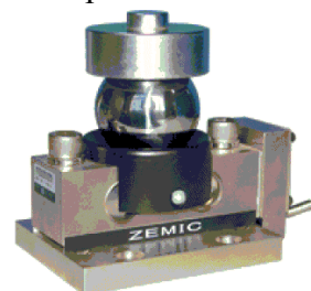
Рисунок 6 - Общий вид датчиков серии DNM9A