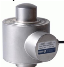
Рисунок 5 - Общий вид датчиков серии DNM14C