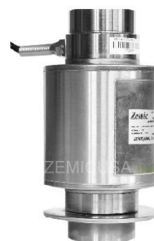
Рисунок 8 - Общий вид датчиков серии DHM14H1