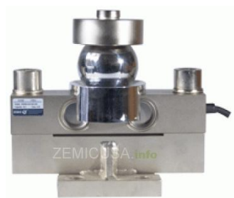
Рисунок 7 - Общий вид датчиков серии DHM9B