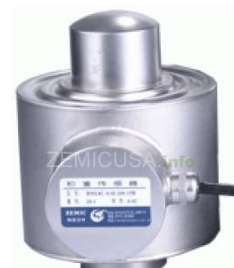
Рисунок 2 - Общий вид датчиков серии DBM14C