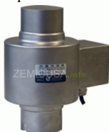
Рисунок 3 - Общий вид датчиков серии DBM14G