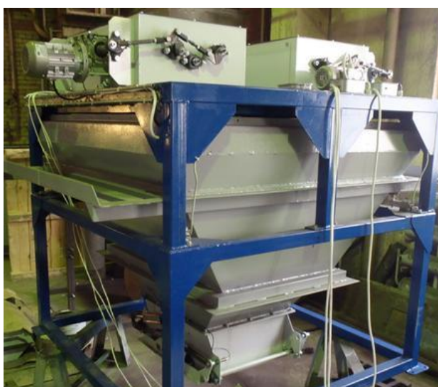
Рисунок 1 – Общий вид дозаторов ДВ