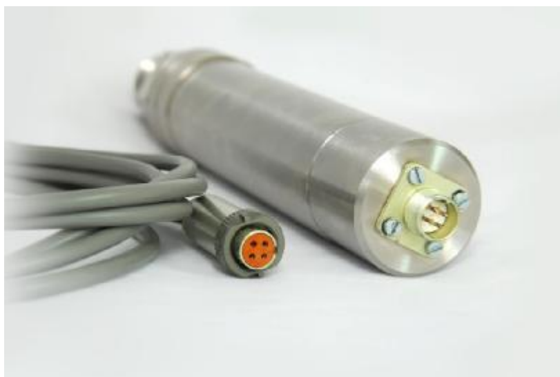
Рисунок 3 – Общий вид датчика интеллектуального с разъемом