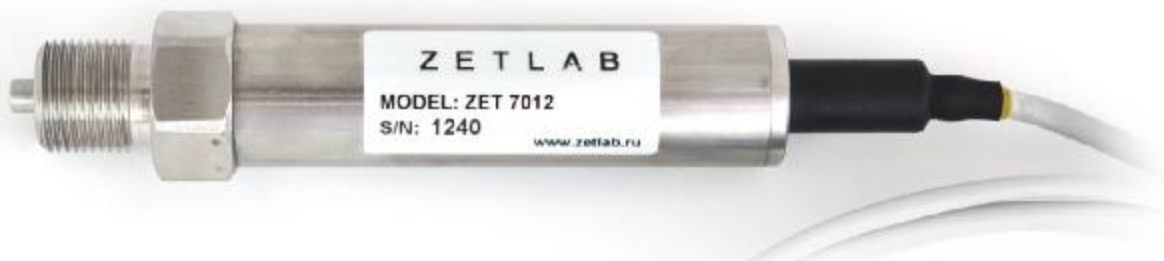
Рисунок 2 – Общий вид датчика интеллектуального с кабельным вводом

Датчики интеллектуальные имеют два варианта исполнения.