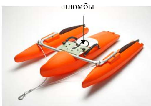
Рис. 2. Схема пломбирования комплексов River Ray.