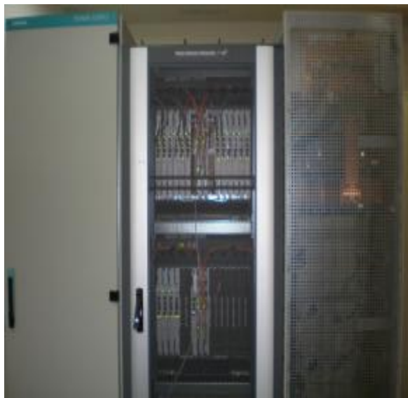
Рисунок 1 - Общий вид оборудования с открытой дверью

Общий вид оборудования и схема пломбировки от несанкционированного доступа, представлены на рисунках 1 и 2.