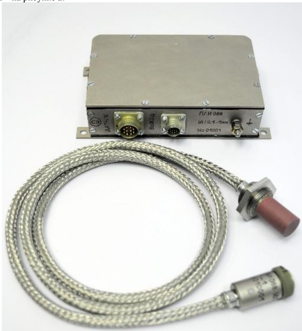
Рисунок 1 - Общий вид датчика ПЛИ 088

Общий вид датчика ПЛИ 088 приведен на рисунке 1, габаритные и установочные размеры – на рисунке 2.