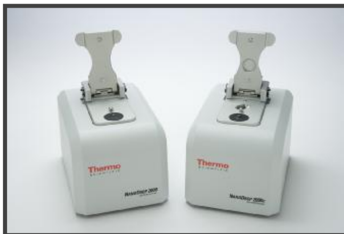
Рис.1 Фотография общего вида анализатора NanoDrop 2000 и NanoDrop 2000C.

Анализаторы NanoDrop Lite работают при двух длинах волн и их аналитические возможности несколько ограничены. При их использовании в отличие от остальных моделей требуется предварительная очистка пробы, и нет возможности определять чистоту веществ по спектральному отношению.