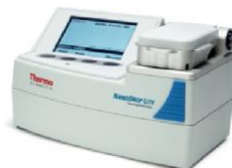
Рис.3. Фотография общего вида анализатора NanoDrop Lite.