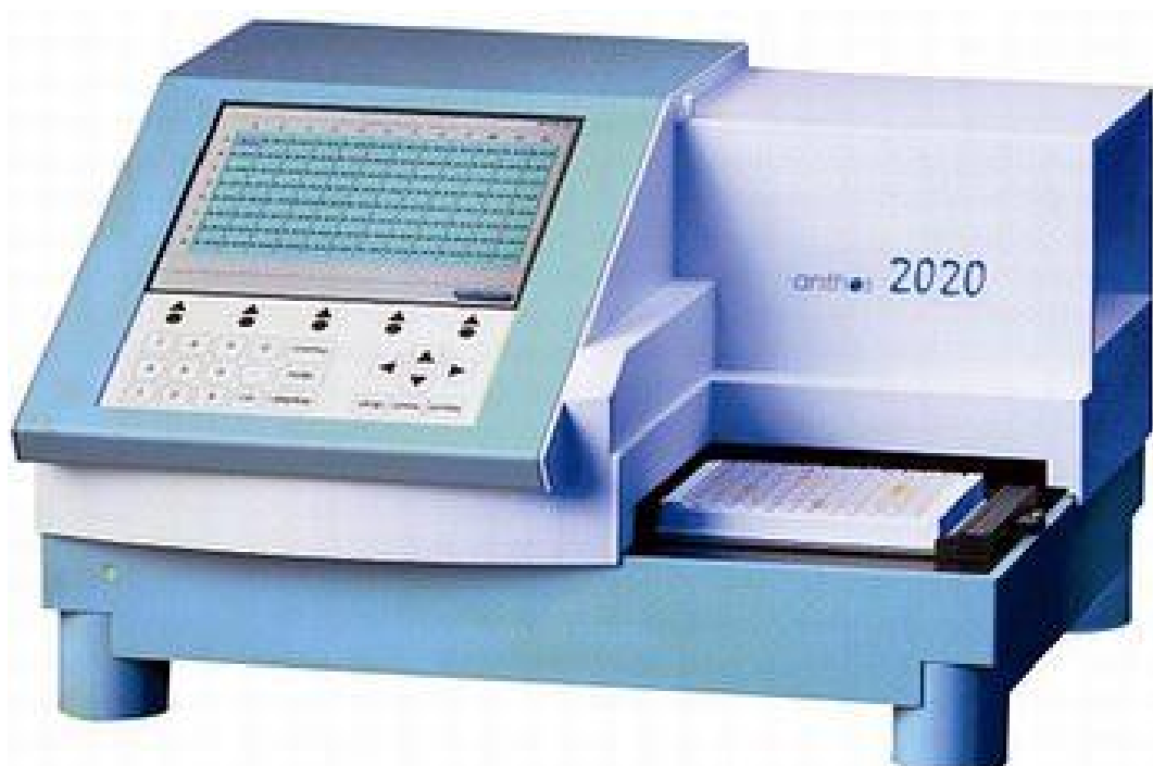
Рисунок 3 – Общий вид Фотометров микропланшетных «Anthos» моделей 2020