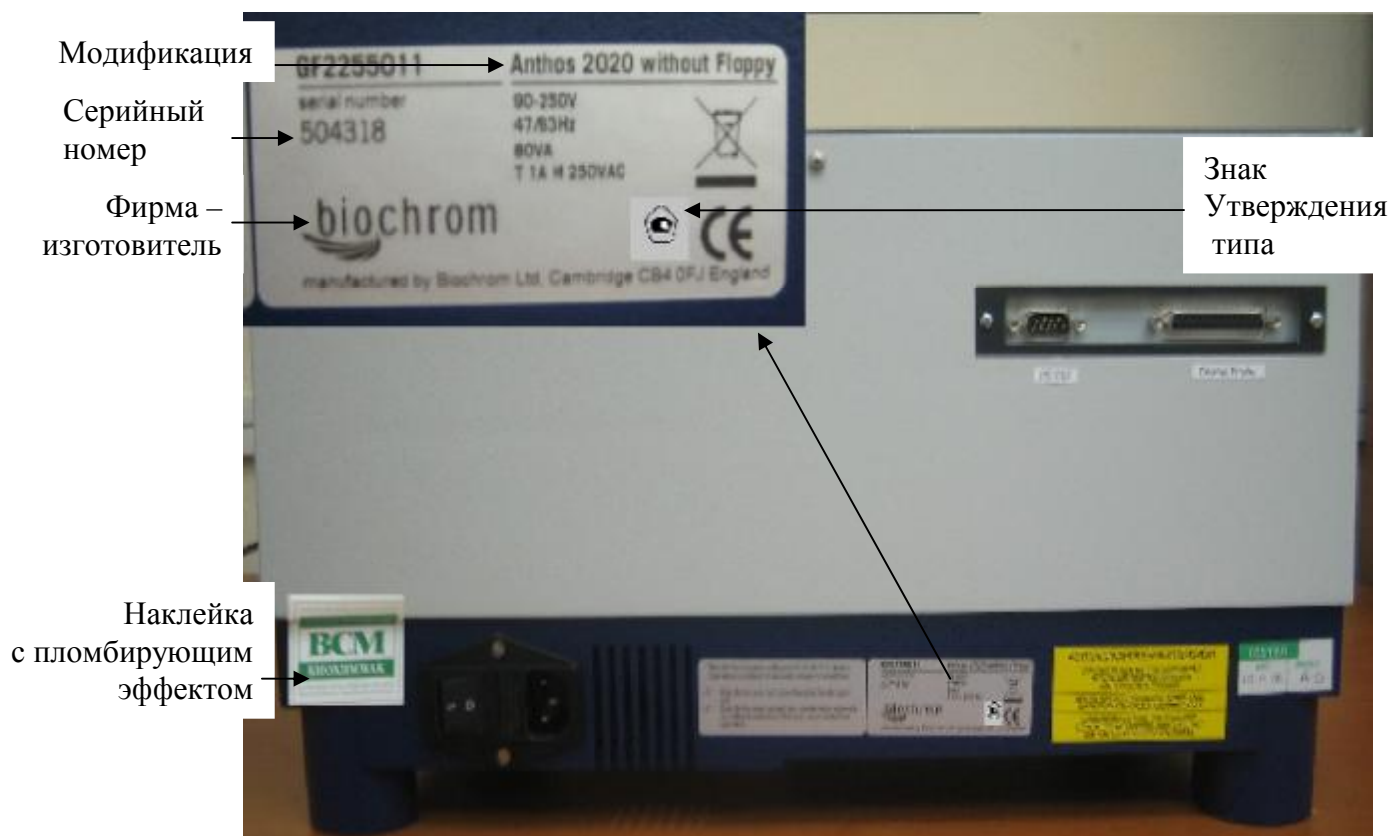
Рисунок 4 – Схема маркировки и пломбировки