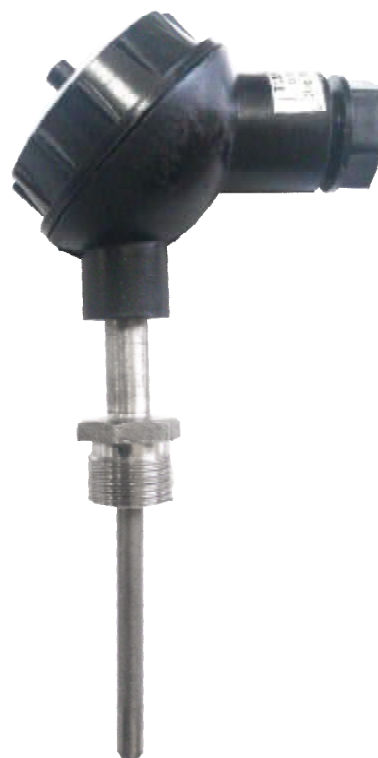
Рисунок 2 – общий вид ТСМУ-16-S

Схема обозначения различных исполнений термопреобразователей с унифицированным выходным сигналом ТСМУ-10-S приведена на рисунке 3.