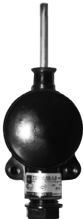
Рисунок 1 – общий вид ТСМУ-10-S

Термопреобразователи с унифицированным выходным сигналом ТСМУ-16-S (рисунок 2) применяются для измерений температуры жидких и газообразных сред (не агрессивных для материала оболочки ТС) и имеют различные исполнения в зависимости от длины погружаемой части ТС и наличия защитной гильзы.