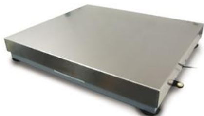
а) S-GA, S-QA, S-QB, S-SK, S-TK, S-UK, S-VK, S-WQ, S-YA, S-YB, S-YC-05, S-YC-1, S-YC-30, S-YE, S-GB, S-GC, S-GD, S-WPP, S-SC, S-SB, S-ES, S-PS

Общий вид ГПУ и терминалов показан на рисунках 1 и 2 соответственно.