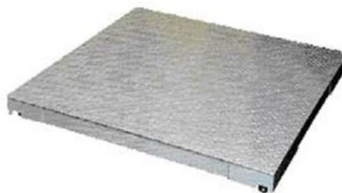
б) ГПУ модификации S-CS