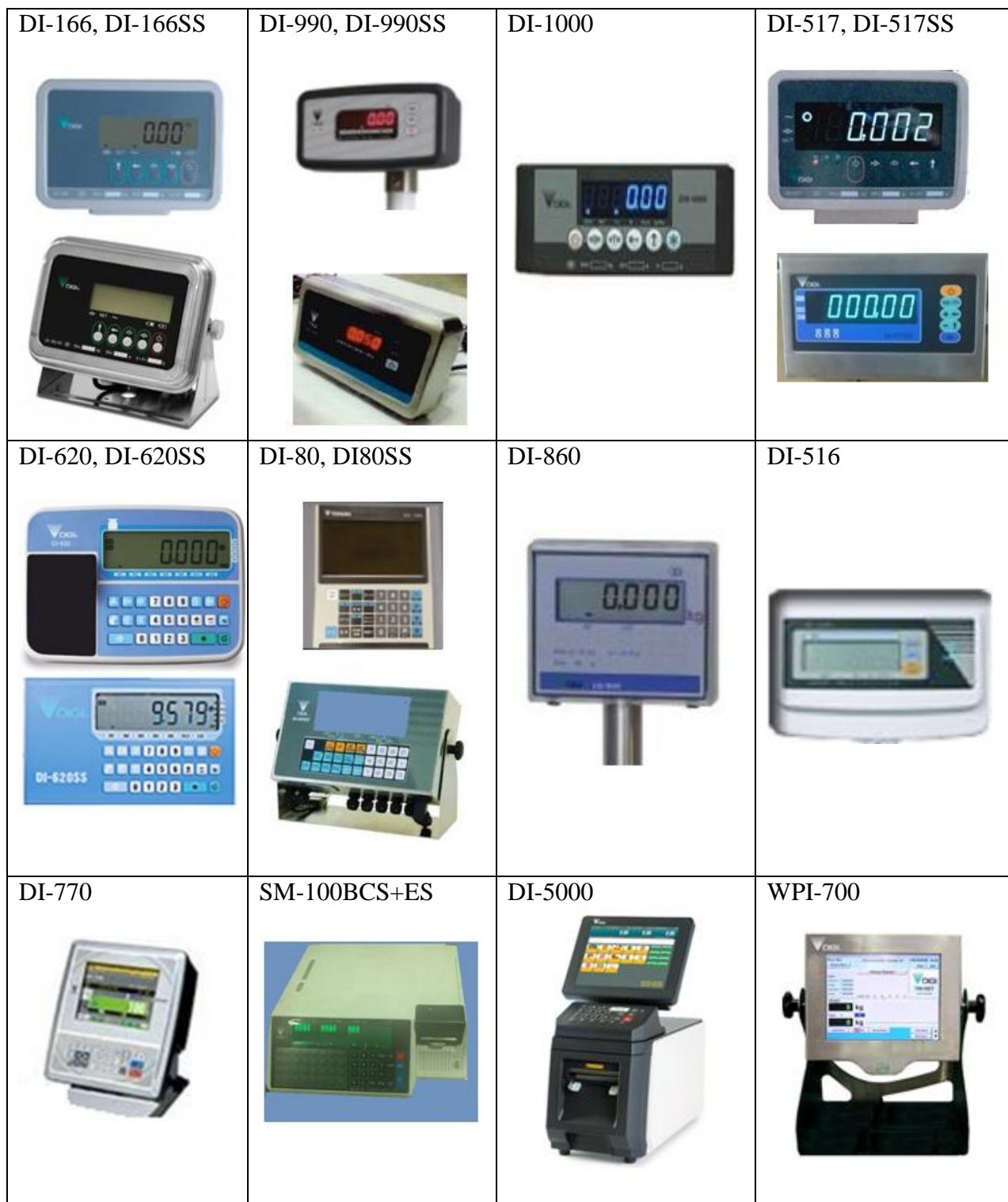
Рисунок 2 - Общий вид модификаций терминалов

Весы имеют следующие устройства и функции: