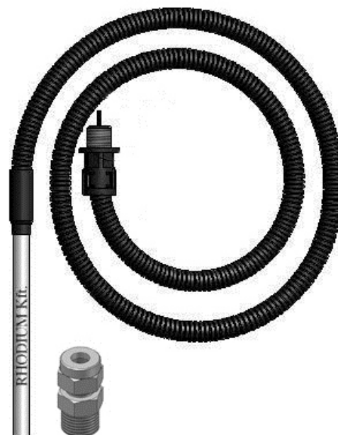
Рис.2. ТС модели NZB