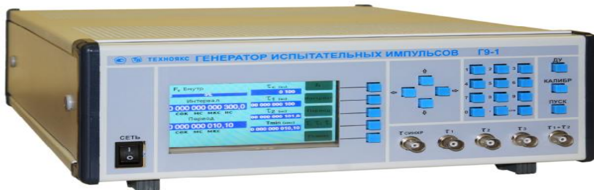
Рис. 1 Общий вид прибора.

Общий вид прибора приведен на рисунке 1.