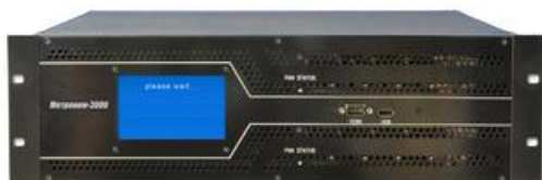
Метроном версии 3000