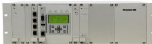
Метроном версии 900