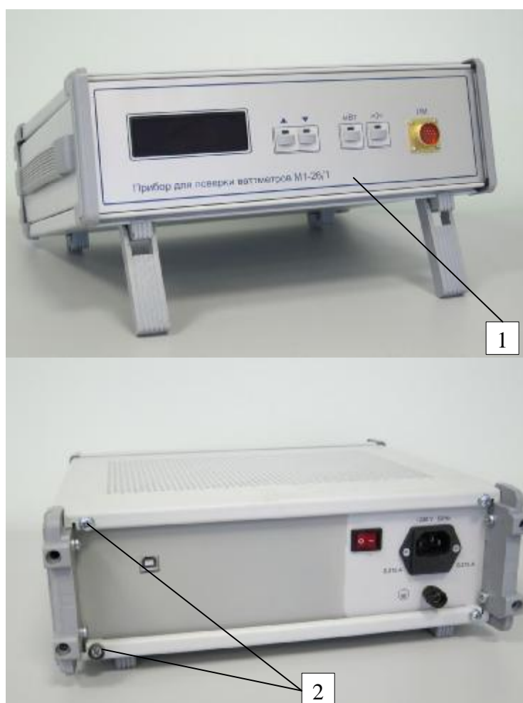
Рисунок 1 – Прибор М1-26. Внешний вид блока прибора (вид спереди и вид сзади)