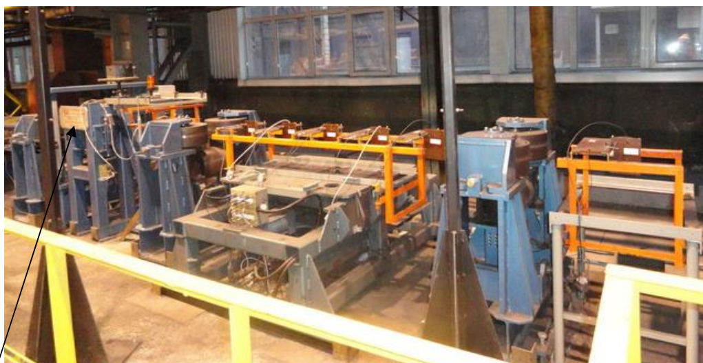
Место нанесения Знака утверждения типа

Затем, числовой массив местных прогибов по каждой плоскости сравнивается с соответствующими браковочными уровнями, после чего принимается решение об отнесении проконтролированного рельса к тому или иному сорту по критериям прямолинейности и операционный блок при помощи краскоотметчиков автоматически (специальным образом) помечает проконтролированный рельс.