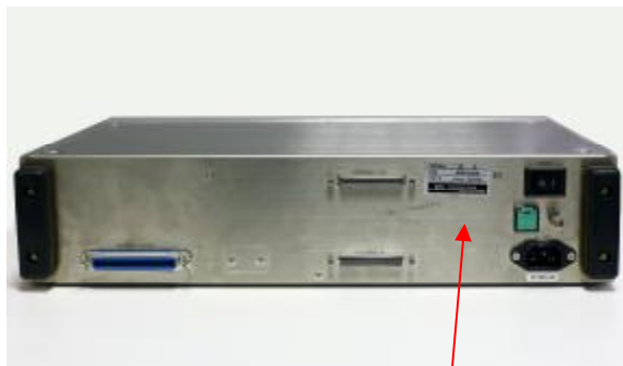
Рисунок 1 Места для наклеек

Внешний вид платы PCI-адаптера интерфейса I/F K2ST-34-001, кабеля интерфейса I/F, USB-ключа и CD-диска с ПО приведен на рисунке 5.