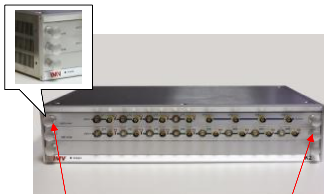
Рисунок 2 Места для пломбировки