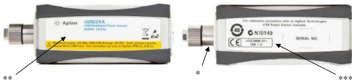
Рисунок 2 – Вид преобразователя измерительного U2022XA