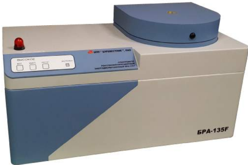
Рисунок 1 - Спектрометр рентгенофлуоресцентный энергодисперсионный БРА-135F. Внешний вид.