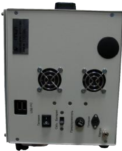
Рисунок 3. Вид справа