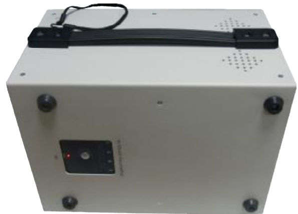
Рисунок 2. Вид сзади и сверху