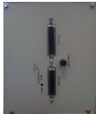
Рисунок 4. Вид слева