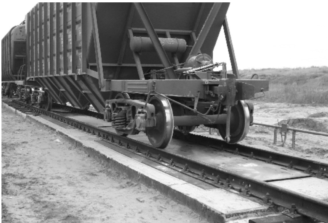
Рисунок 1 – Общий вид ГПУ весов

Сигнальные кабели датчиков подключены к электронному весоизмерительному устройству через клеммную и распределительную коробки.