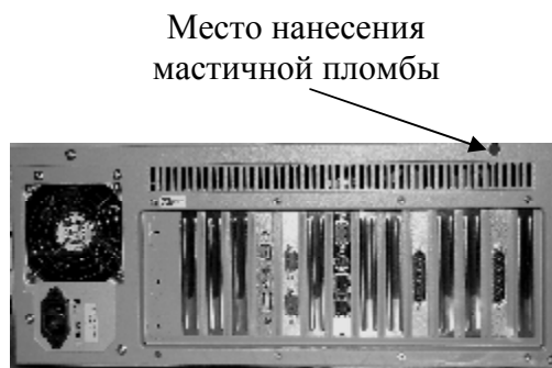
Рисунок 4 – Схема пломбировки индикатора М1РС-01 и терминала М1РС-03