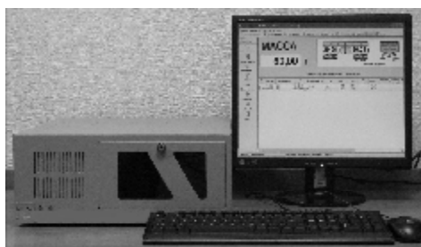
Рисунок 2 – Общий вид индикатора М1РС-01 и терминала М1РС-03