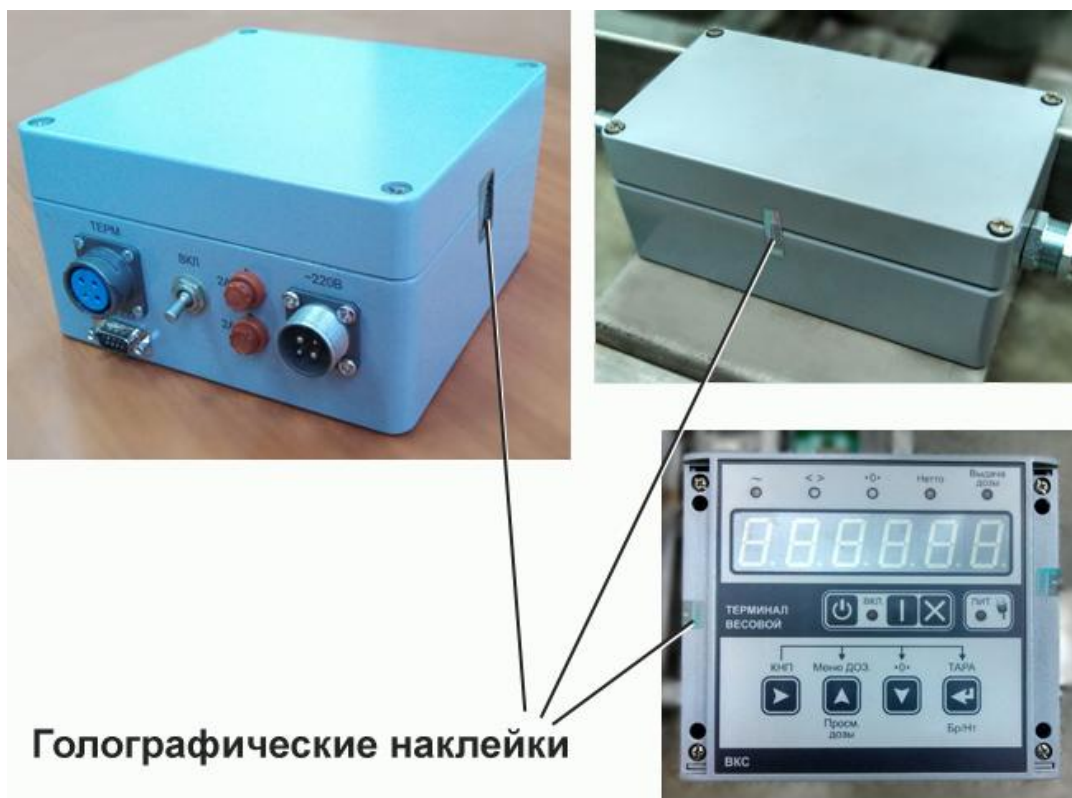
Рисунок 3 - Схема пломбировки ТВ, блока АЦП и БП