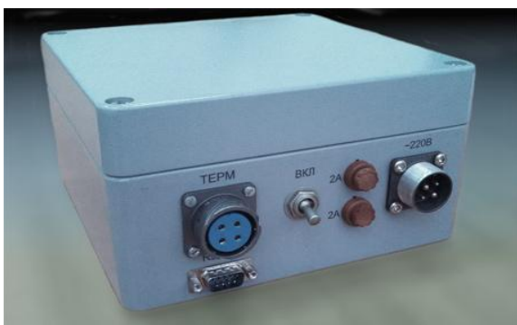
Блок питания ВКС

Общий вид весов ВКС показан на рисунке 1.