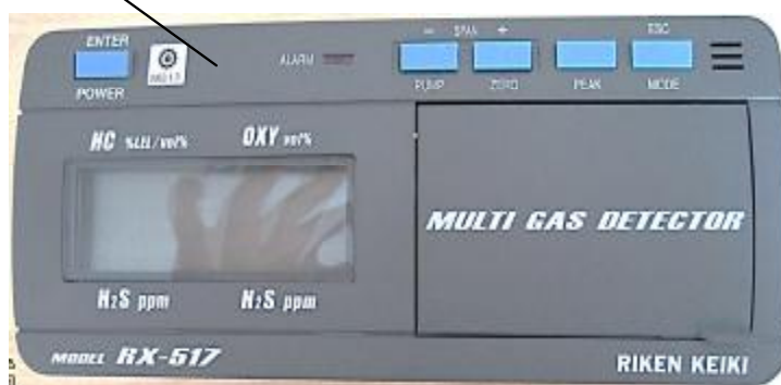
Рис. 2. Панель управления газоанализатора RX-517