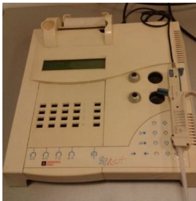
Рисунок 1 – Анализатор гемостаза полуавтоматические STart.

Температура инкубатора выводится на экран при включении прибора, после нагрева. Результат теста «Протромбиновое время» выводится на экран в секундах.